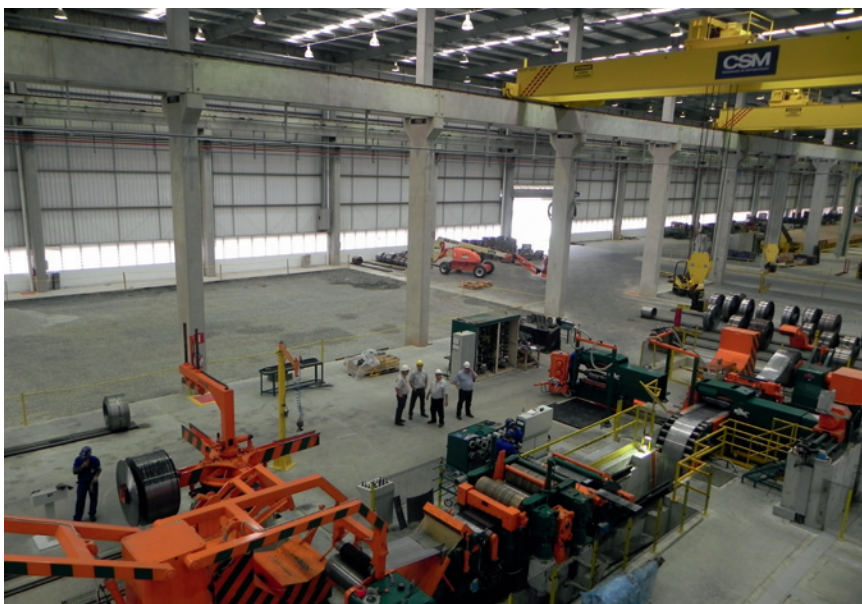
Pontes rolantes equipadas com tenazes melhoram a eficiência