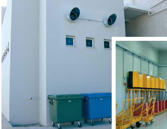
Construída em um anexo do CD, a sala de baterias da Cyber Logística tem ventilação forçada