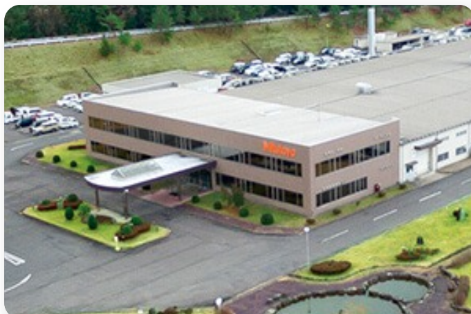
Visita - (TARDE): Mazak