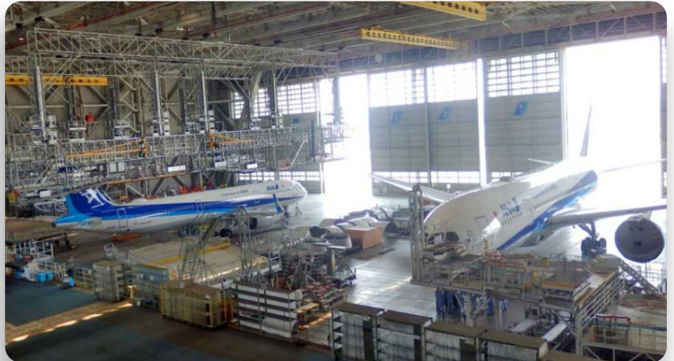
Visita Técnica - (Tarde): Ana Blue Hangar

*Programação sujeita a alterações sem aviso prévio!