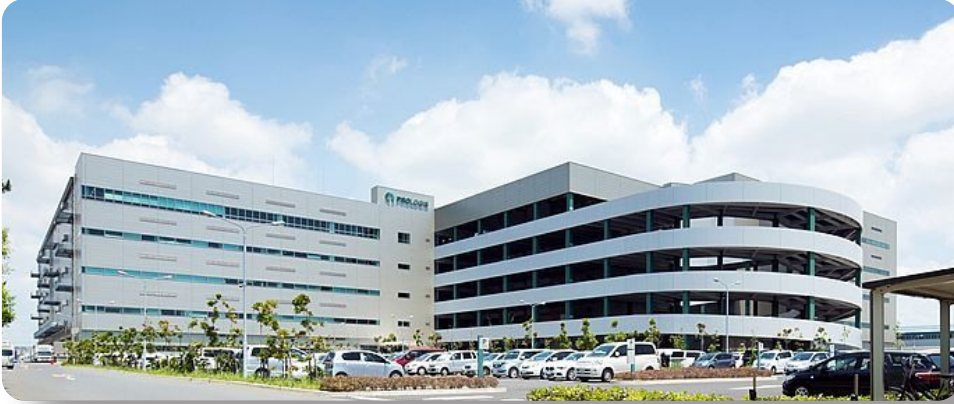
Visita Técnica - (Manhã): Prologis Park