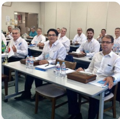
Manhã: Palestra na Toyota Engineering