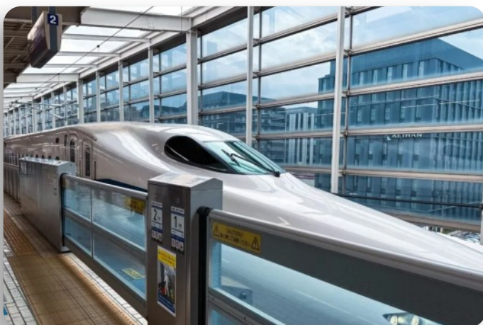
Traslado Nagoya Tokyo por trem bala (Noite)

*Programação sujeita a alterações sem aviso prévio!